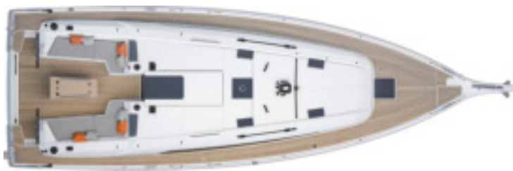
Ausführung mit 2 Kabinen 1 Badezimmer